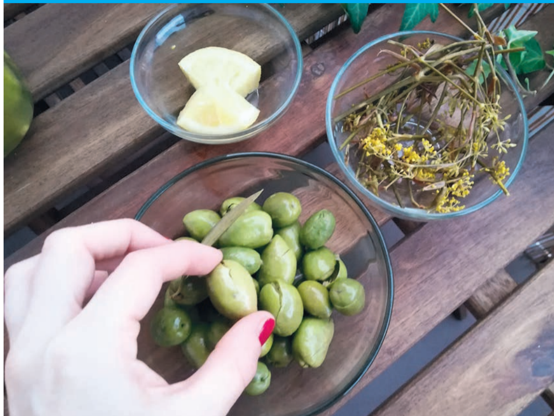
Grüne Oliven mit Zitrone und wildem Fenchel.

Kleine unreife, überwiegend grüne Oliven müssen zuerst zerdrückt werden, bis sie leicht aufplatzen. Alberola macht das mit seinem kräftigen Handballen, zarter Besaitete nehmen einen Stein und hauen damit kräftig drauf. Eine Handvoll der zerdrückten Oliven wird in ein großes Glas mit Schraubverschluss gefüllt. Darauf kommen zwei Zitronenstücke. „Man sollte die Zitronen so nehmen, wie sie jetzt am Baum hängen: noch grün“, erklärt Alberola. Handelt es sich um eine sehr unreife, kleine Zitrone, wird sie einfach geviertelt. Bei größeren Zitronen, die schon viel Saft haben, sollte dieser erst grob mit der Hand herausgedrückt und an-