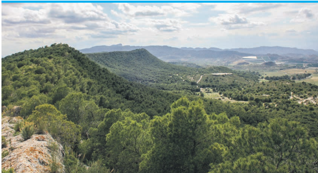
Das Spektakuläre ist das Fehlen von Spektakel – und von Zement: Sierra Escalona.

Damit soll jetzt zumindest für das Kerngebiet Schluss sein, Valencias konservativer Landeschef Carlos Mazón will die endgültige Deklaration zum Naturpark in Landeshoheit Valencias umsetzen und rühmt sich, damit ein (in Worten: eins) Wahlversprechen umzusetzen. Auf noch 9.000 Hektar, also grob zehn mal neun Kilometer, ist das einzige geschlossene Waldsystem der Vega Baja zusammengeschnitten worden, die Natur hat es rund sechs Mal so groß konzipiert und die Ökos, die seit Jahrzehnten um den Schutz kämpften, rechneten mit 25.000 Hektar. Doch das Zögern der