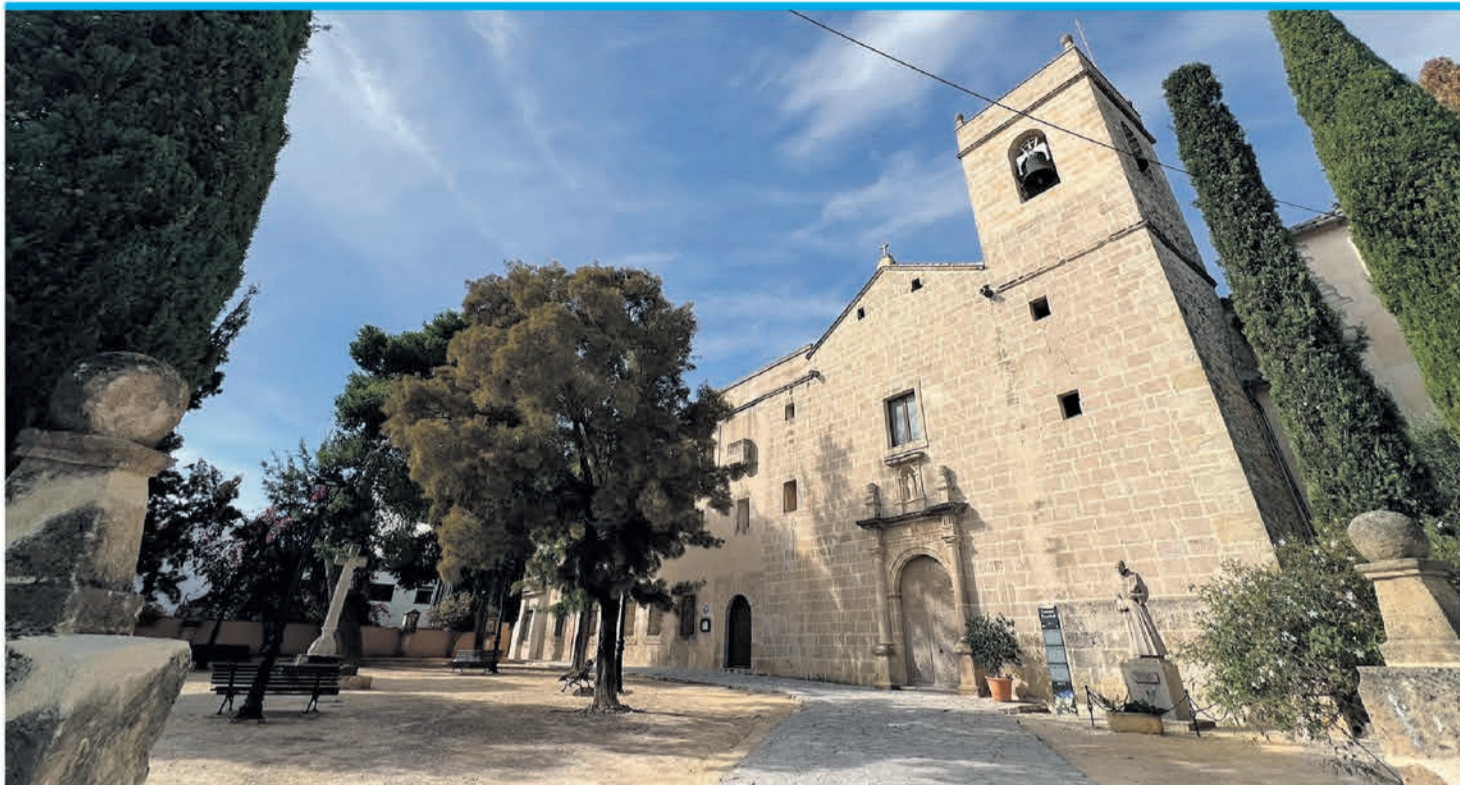
Das Konvent der Franziskaner aus dem 17. Jahrhundert steht am westlichen Ende der Altstadt.

Auf dem Weg vom Rathaus entlang der Calle de la Puríssima