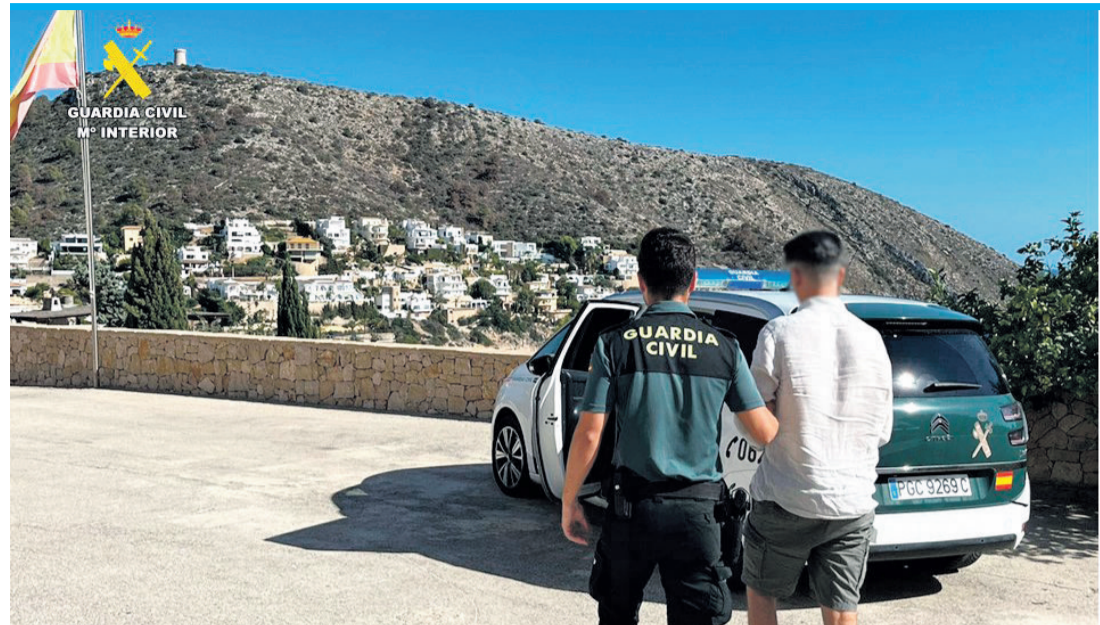
Der Verhaftete (o.) und sein „Guthaben“ (l.).

Als die Guardia Civil am 14. September aus der Bevölkerung einen Hinweis zu einem Diebstahlversuch an einem Bankautomaten in Moraira erhielt und Zeugen eine Beschreibung des mutmaßlichen Täters lieferten, konnten die Beamten den Mann schnell lokalisieren und identifizieren. Als der Franzose