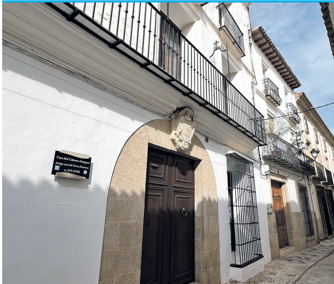
In der Calle de los Desamparados lebten früher die Reichen.

Zum Einkaufen bietet Benissa neben dem Bücherladen einige Kleiderboutiquen, Obst- oder Bioläden sowie ein Blumengeschäft. Das aufregendste Shoppingerlebnis ist in Benissa immer samstags, wenn in den Straßen San Nicolás, San José und Hort de Bordes der Wo-