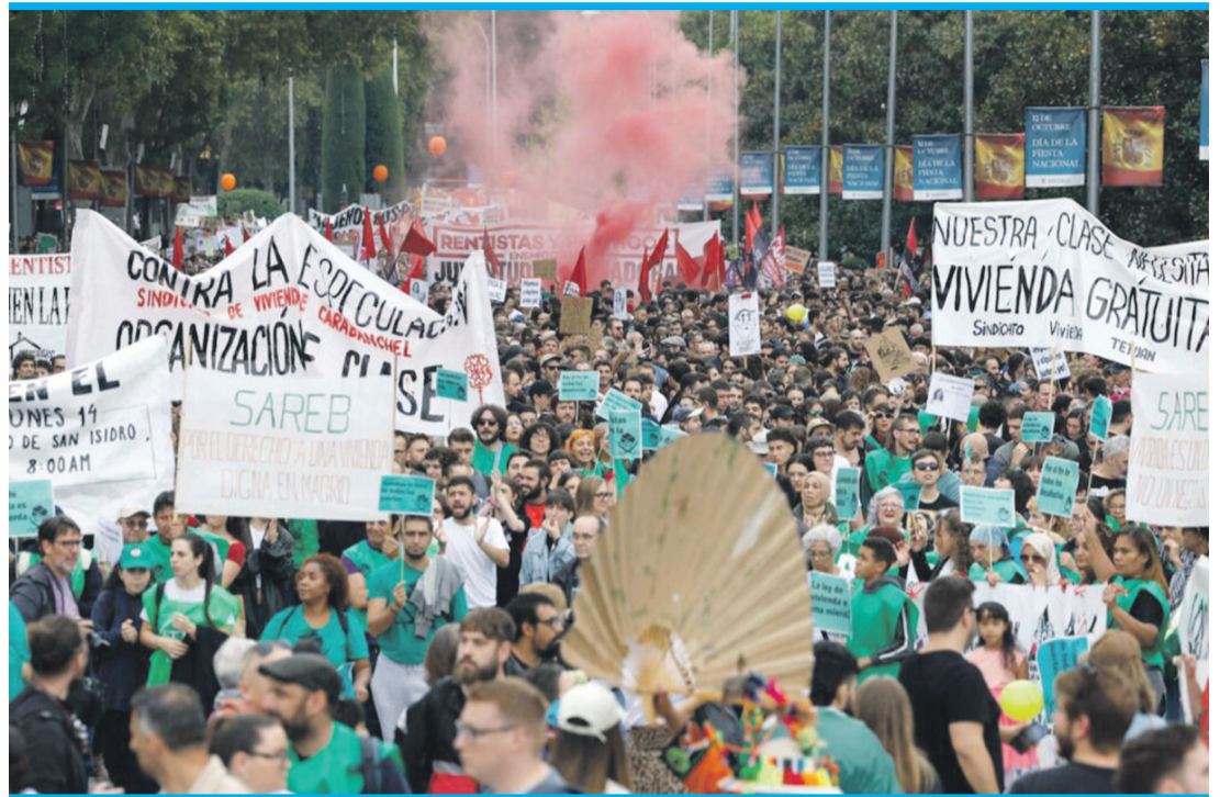
Die Proteste werden lauter: die jüngste Demo in Madrid.