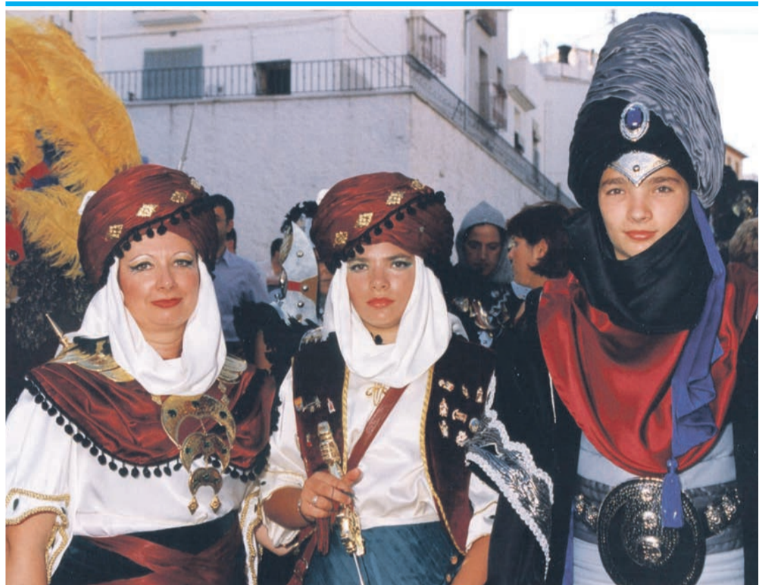
Jahr für Jahr ist die Fiesta einer der Höhepunkte. Hier ein Foto von 1999.

Rund 500 Teilnehmer und elf Filàs gebe es mittlerweile, und vor wenigen Wochen ist feierlich das 50. Moros-y-Cristianos-Jahr in Benissa eingeläutet worden, das seinen Abschluss bei den Fiestas im Juni 2025 finden wird. Die Idee dafür, die schillernde Fiesta auch ins kleine Benissa zu holen, hatten die „Festeros“ von 1975, weil der Montagnachmittag der Puríssima-Fiesta oft ein wenig langweilig war. Mit ein paar Mauren und Christen auf der