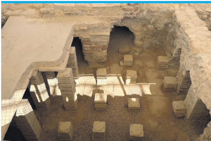
Die Thermalbäder mit Heizungssystem.

Der Küstenweg ist rund vier Kilometer lang und eignet sich perfekt für Spaziergänger, Radler oder Läufer. Der Weg ist deutlich in Fußweg, Fahrradweg und Straße (mit Tempolimit 20 Kilometer pro Stunde) unterteilt, was die Sicherheit für alle Nutzer gewährleistet. Auch Familien mit Kinderwagen sowie Rollstuhlfahrer können diesen Weg problemlos nutzen. Das Museum Villa Romana öffnet dienstags bis freitags von 10 bis 13 Uhr, am Wochenende von 10 bis 14 Uhr.