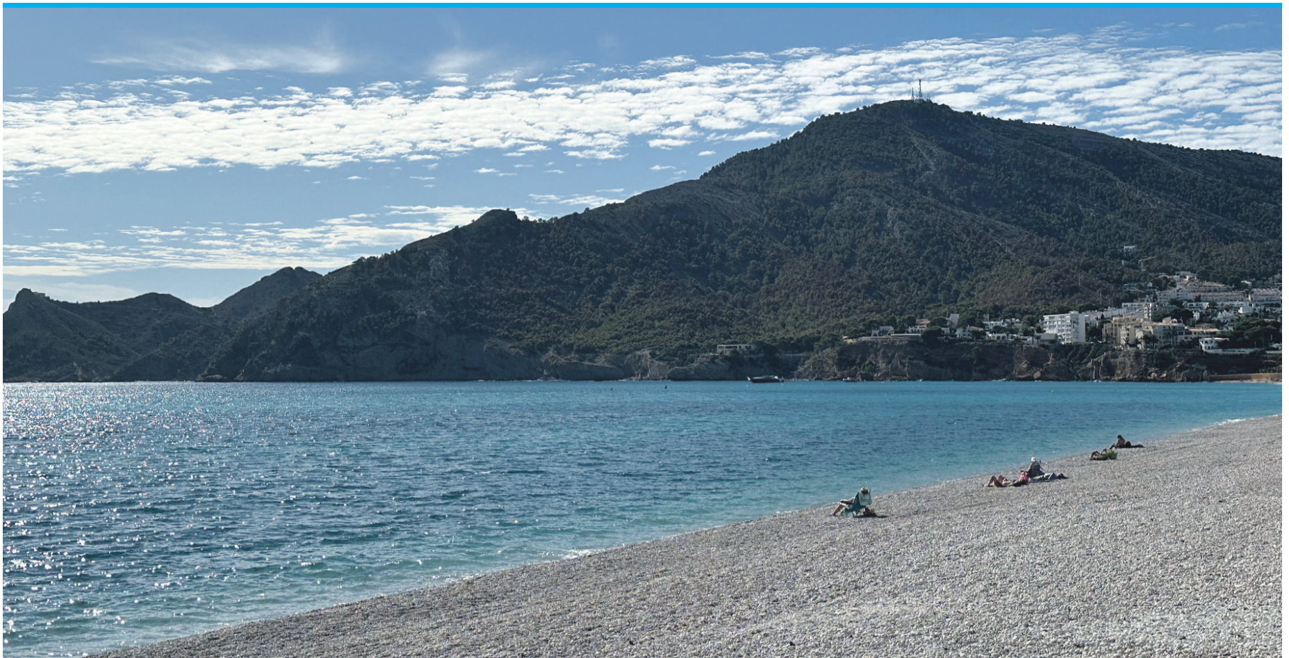
Unterwegs sind das Meer und die imposante Sierra Helada ständige Begleiter.