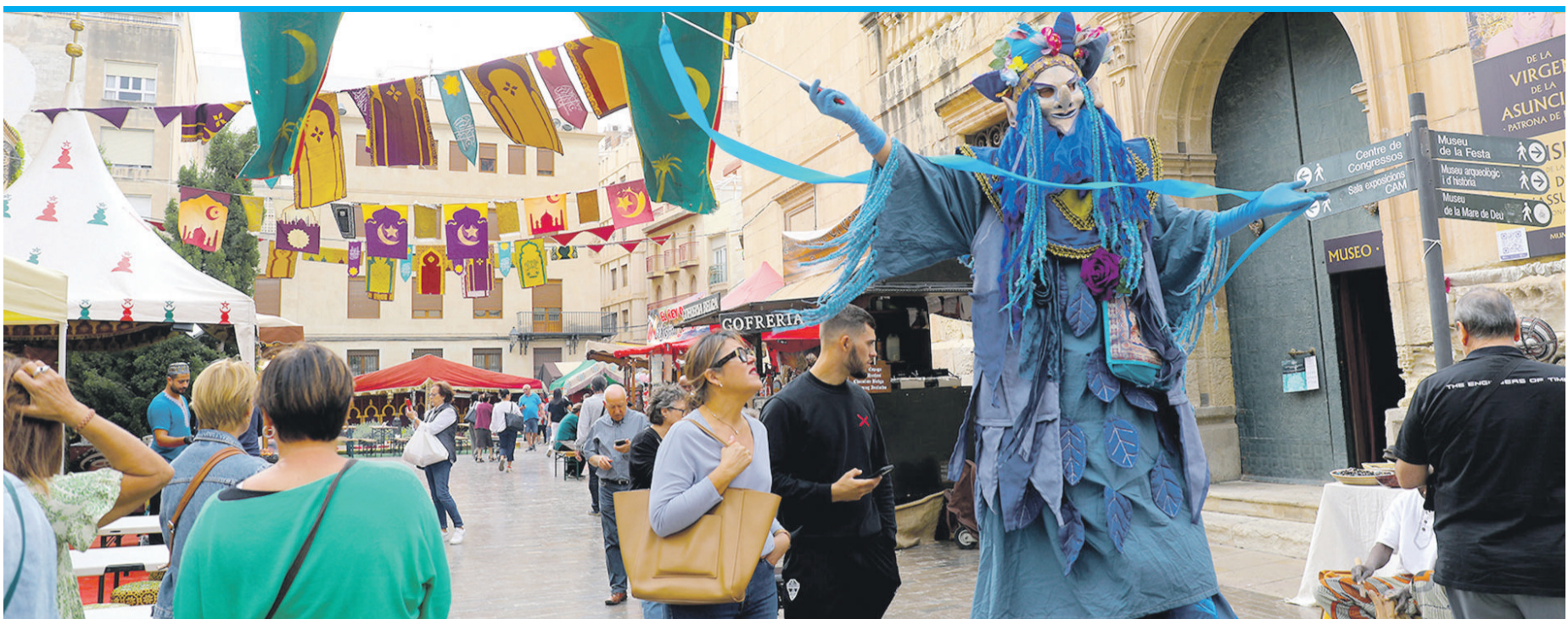
„Arabischer“ Markt und „venezianischer“ Karneval vor den Toren der Basilika von Elche.