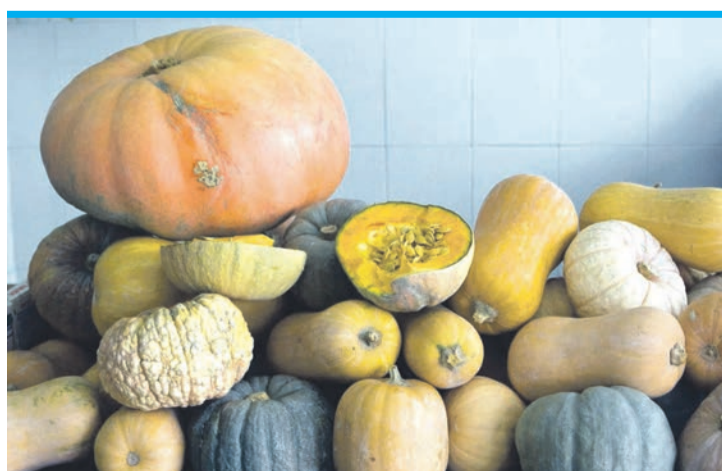
Es gibt mehr als 800 Kürbisarten.

Tipp: Um die Walnüsse zu rösten, Ofen auf 180 Grad vorheizen. Nüsse auf Backpapier streuen und zehn Minuten bräunen. Für das Kürbispüree den Stiel vom Kürbis ausschneiden, Kürbis in Achtel schneiden, Kerne und das weiße Innere entfernen. Schale wegschneiden, Fruchtfleisch in Würfel schneiden. Kürbiswürfel in etwas Wasser weich kochen, anschließend pürieren.