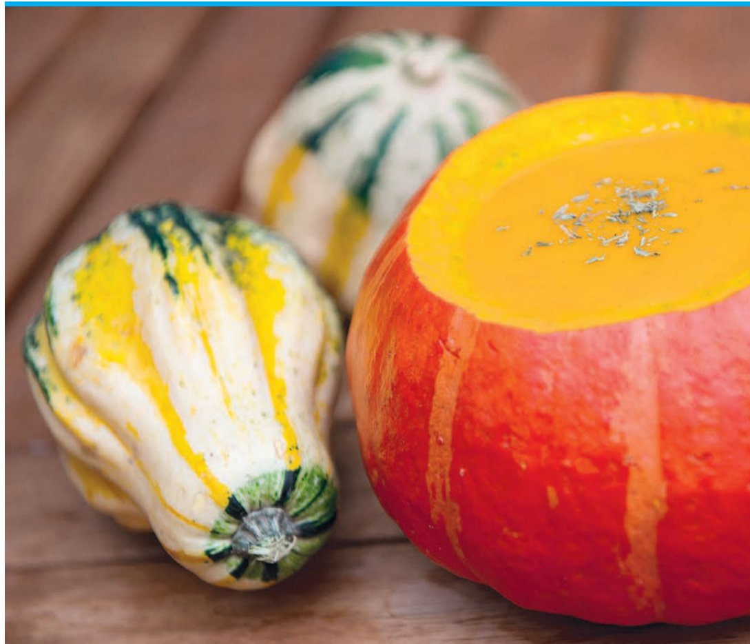
Schmeckt und sieht hübsch aus: Kürbissuppe kann man direkt in dem ausgehöhlten Kürbis servieren.

Die riesige Kürbisfamilie – etwa 100 Gattungen und mehr als 800 Arten sollen existieren – ist nicht einfach auseinanderzuhalten. Grob unterscheidet man zwischen Sommer- und Winterkürbissen. Zu den weichschaligen Sommerkürbissen zählen zum Beispiel die Gartenkürbisse wie Zucchini, die runden Rondini oder die flachen Patissons und auch der so genannte Spaghettikürbis, dessen Fruchtfleisch sich nach dem Garen wie Nudeln mit der Gabel essen lässt. Diese wasserreichen Kürbisse, zu denen