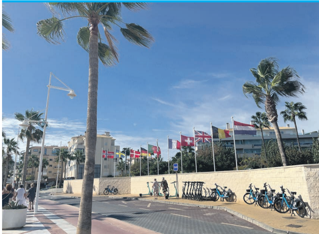
Flaggen entlang der Küstenpromenade in Albir.

Nicht nur für Kulturinteressierte lohnt sich wiederum ein Besuch im Freilichtmuseum