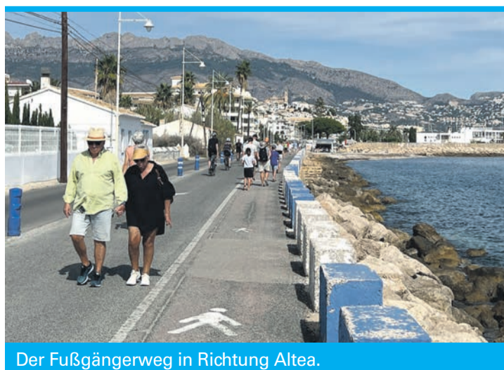
Der Fußgängerweg in Richtung Altea.

Doch nicht nur Touristen sorgen für internationales Flair in Albir, das zu der Stadt L'Alfàs del Pi gehört, sondern auch die Bewohner selbst: Von den rund 21.000 Einwohnern der Stadt stammen etwa 12.500 nicht aus Spanien, was der Gemeinde einen besonderen kulturellen Mix beschert. Viele Ausländer schätzen das milde Klima, die abwechslungsreiche Küche und die beeindruckende Berglandschaft, die diesen Ort so einzig-