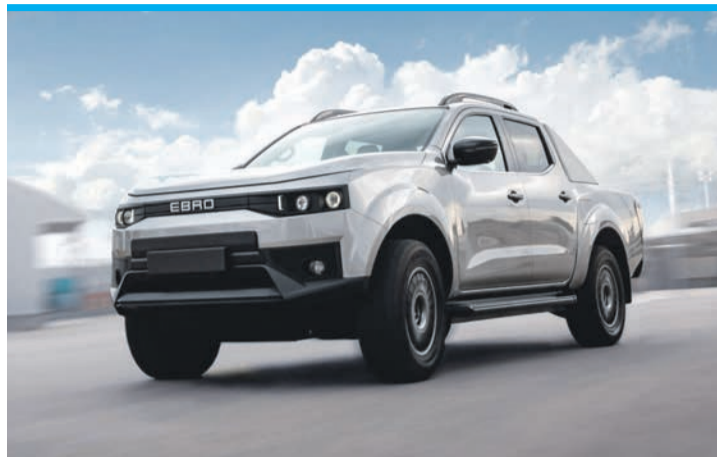
Der neue Ebro Pickup.

Den fand EV Motors in dem chinesischen Hersteller Chery. Das Unternehmen ist Chinas größter Auto-Exporteur und drittgrößter Produzent. Chery drängt wie