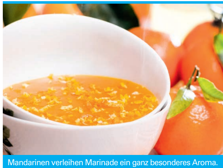
Mandarinen verleihen Marinade ein ganz besonderes Aroma.

Auch winterlichen Salaten verpasst Mandarine eine fruchtig-erdige Note. Leidenfrosts Tipp: Radicchiosalat, Mandarinenfilets, Steinpilze, Walnüsse oder Pekannüsse mischen und mit Mandarine-Joghurt-Dressing servieren. Das Dressing wird mit Mandarinsaft und Joghurt angerührt und mit Olivenöl, weißem Balsamico sowie Salz und Pfeffer abgeschmeckt.