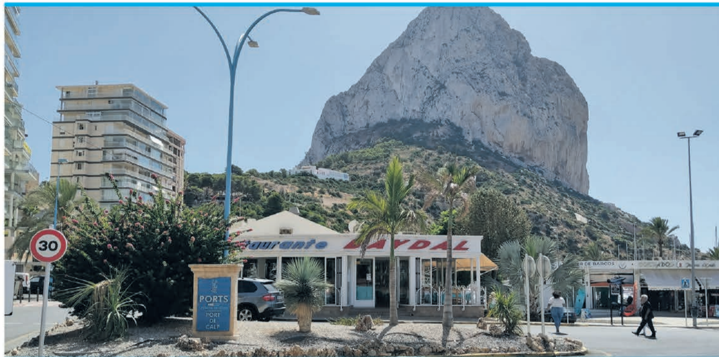
Im Restaurant Baydal verhalf ein feiner Gast dem Arroz del Senyoret zur Geburt.

Eine Spezialität, die man unbedingt probieren sollte, ist der Arroz del Senyoret. Dieses Reisgericht stammt aus den 1980er Jahren aus dem Restaurant Baydal und von einem wohlhabenden Gast aus Madrid, der es leid war, sich beim Essen der Meeresfrüchte die Finger schmutzig zu machen. Er bat darum, dass die Meeresfrüchte für ihn bereits