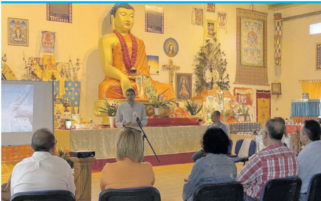
Das buddhistische Zentrum in Abanilla.