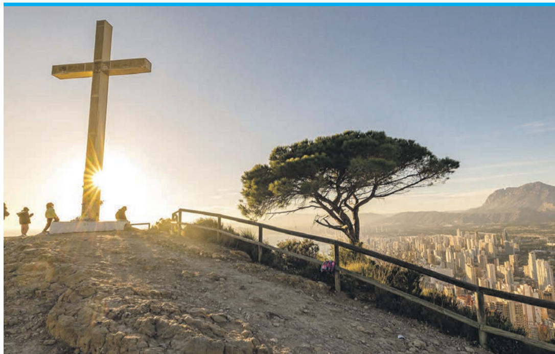
Heute ist das Kreuz auf der Sierra Helada ein beliebtes Ausflugsziel.