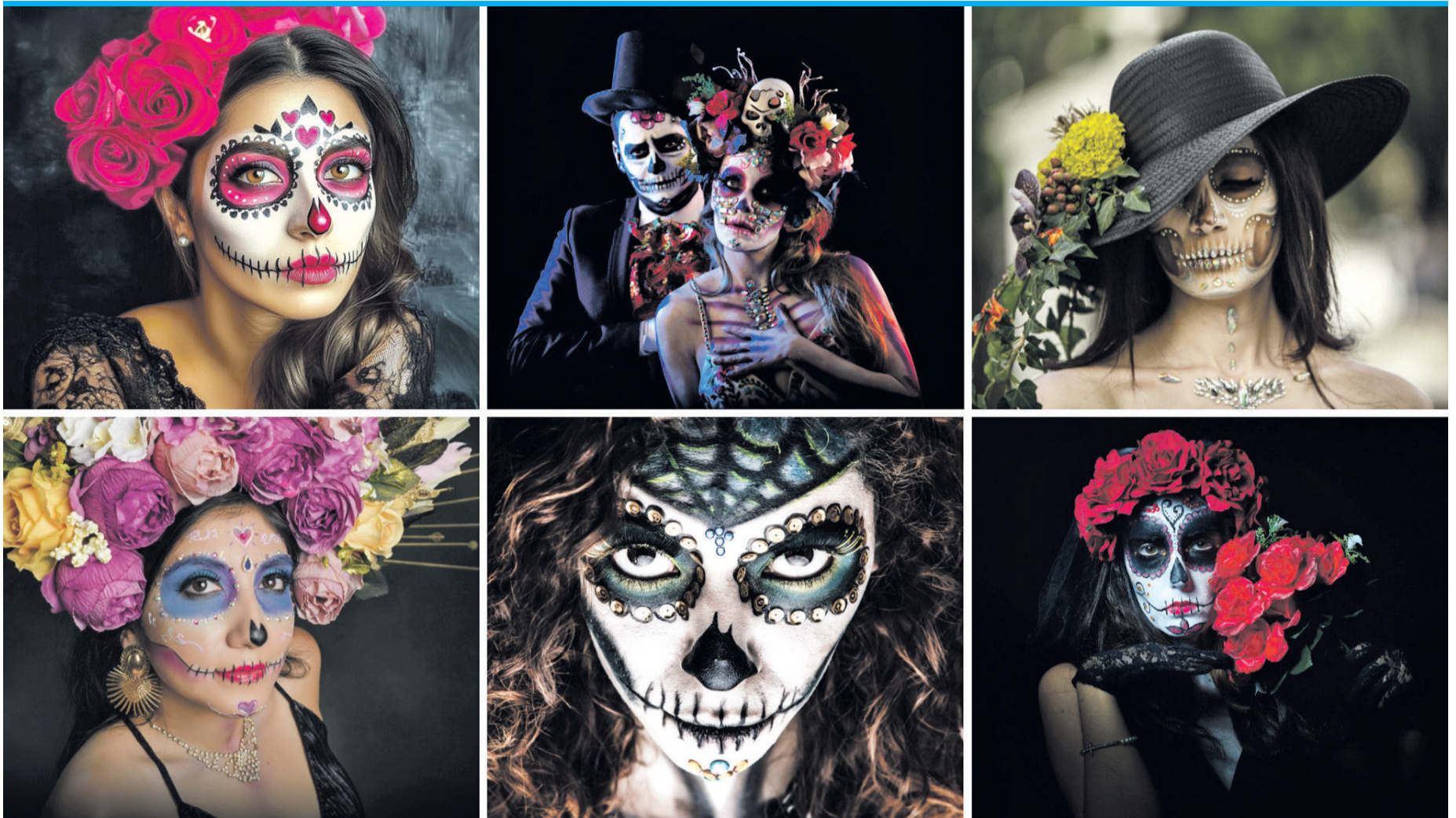
La Catrina – kunstvoll bemalte Gesichter zum Día de los Muertos, die Leben und Tod feiern.