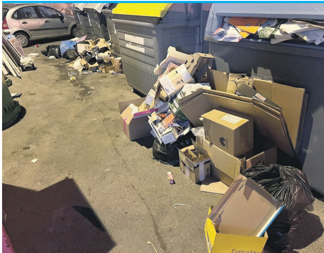
Im Sommer sind solche Bilder in Orihuela Costa keine Seltenheit.

Auch eine Facebook-Userin beklagt sich auf der Rathausseite über den „Müll, der überall herumliegt“ und nicht weggeräumt werde, Bürgersteige und Straßen, die kaputt seien und nicht repariert werden. Sie sei