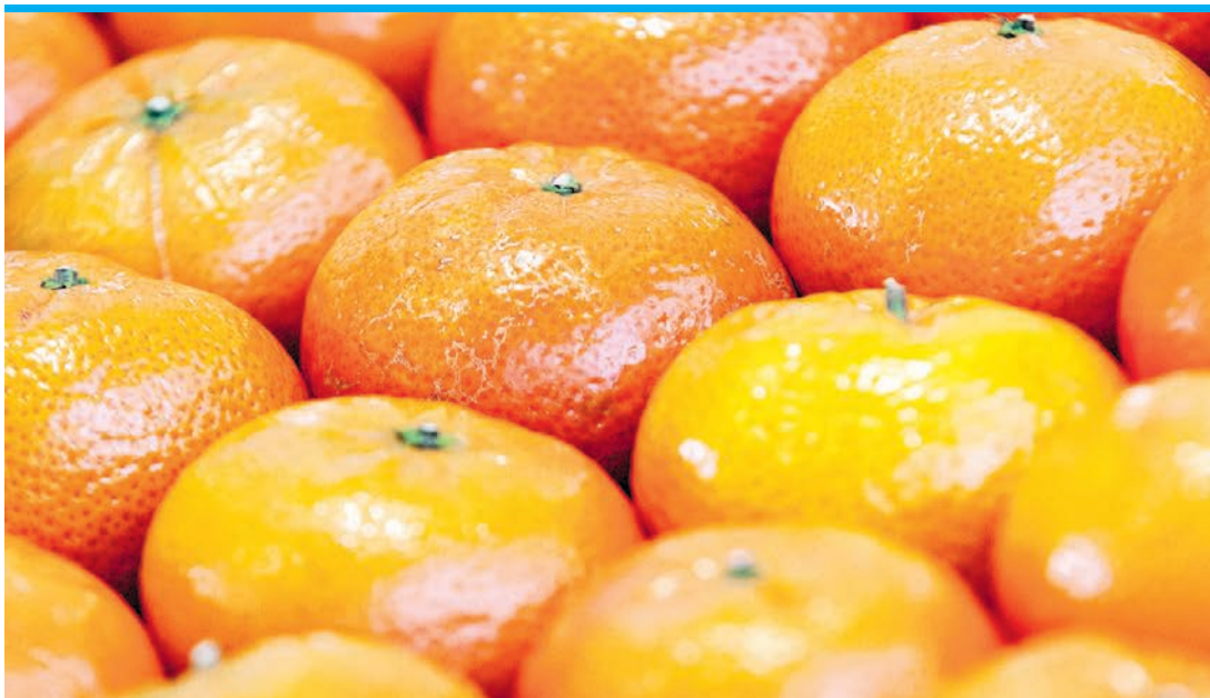
Mandarinen (Citrus reticulata) haben bis Januar Saison.