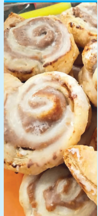
Die Nussschnecken machen optisch was her.

Dann den Teig länglich aufrollen und die Nähte am Schluss gut zusammendrücken.