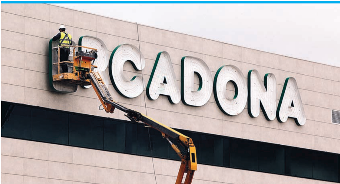
Mercadona bleibt klar Marktführer im Einzelhandel.