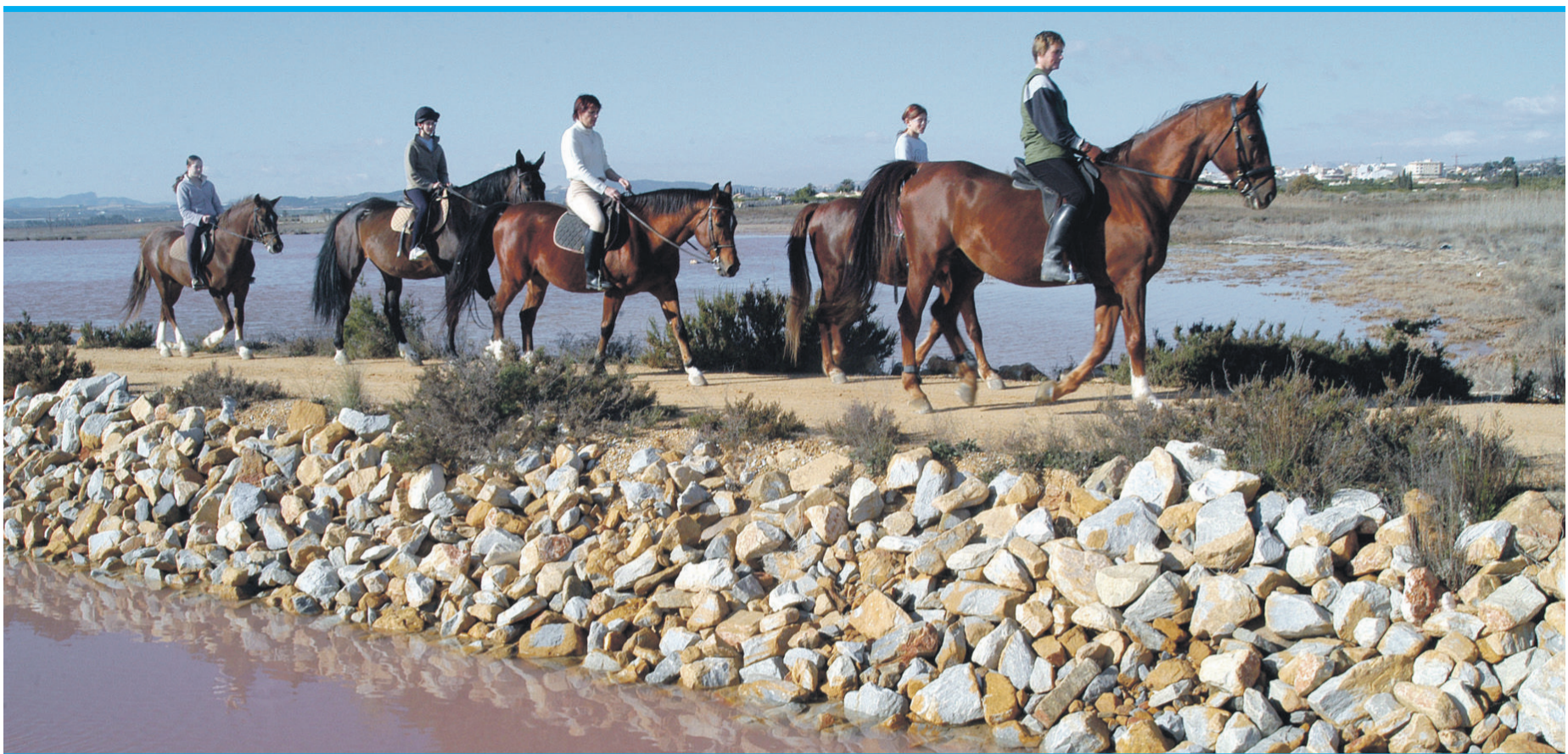
Die Region La Mata bietet sich ideal für Spaziergänge an.