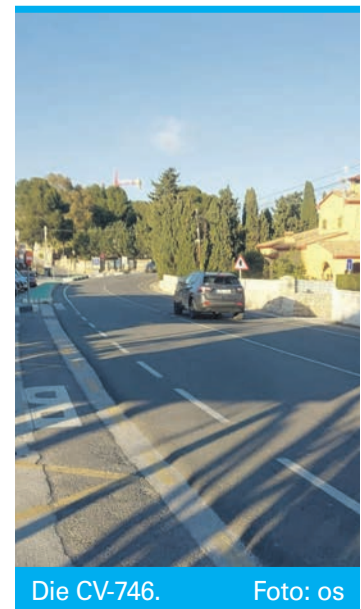
Die CV-746.

Die Stadtverwaltungen von Calp und Teulada-Moraira sind sich des Problems bewusst, doch da es sich um eine interurbane Verbindung handelt, liegt die Verantwortung beim Landesverkehrsministerium in Valencia. Teulada-Morairas Bürgermeister Raúl Llobell erklärte, dass man bereits Gespräche mit der Regionalregierung aufgenommen habe, um eine Lösung zu finden. Besonders in der Hochsaison sei der Bus eine wichtige Verbindung zwischen den beiden Orten. Ob es kurzfristig eine Alternative geben wird, ist vorerst noch unklar.