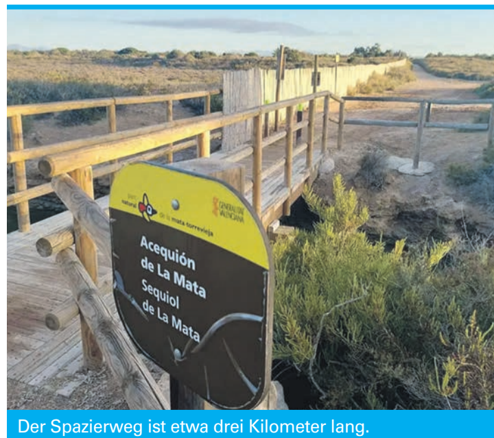
Der Spazierweg ist etwa drei Kilometer lang.

Wir überqueren die Brücke allerdings nicht, sondern kehren um und gehen den breiten Weg weiter, der dicht am Ufer des Salzsees entlangführt. Von hier aus haben wir einen herrlichen Blick auf das weite, flache Ufer des Sees.