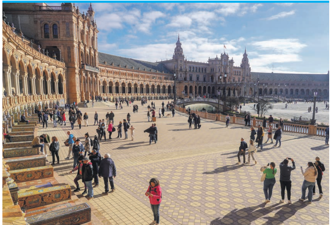
Für viele junge Frauen aus den USA wurde die Reise nach Sevilla zum Horrortrip.

Gabrielle Vega war betäubt und bewusstlos, als er sich an