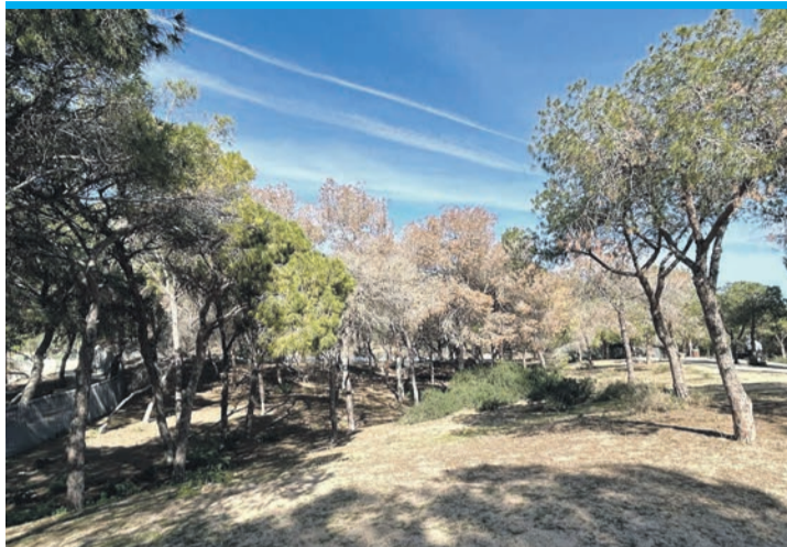
Die Kiefern in Guardamar sterben.

Die sterbenden Kiefern erkennt man an den Nadeln, die sich rötlich verfärben. Besonders betroffen in der Vega Baja sind neben den Sierras in Orihuela und Callosa, die bereits 2014 schwer gelitten haben, die Pinienwälder der Dünen von La Marina in Elche und in Guardamar del Segura. Die Landesregierung ließ bereits 11.000 tote Bäume wegschaffen und erklär-