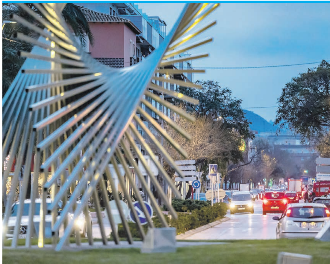
Die Ronda soll die Avenida Miguel Hernández und die Hafenzufahrt entlasten.

Und das mit dem Instrument eines Teilbebauungsplans PAI, bei dem die Erschließungskosten auf Grundstückseigentümer abgewälzt werden. Was sehr teuer werden kann, schließlich liegen die Grundstücke in einem Hochwassergebiet. Eine Bebauung dort unterliegt strengen und kostspieligen Auflagen. Auch bei den Steuerzahlern in