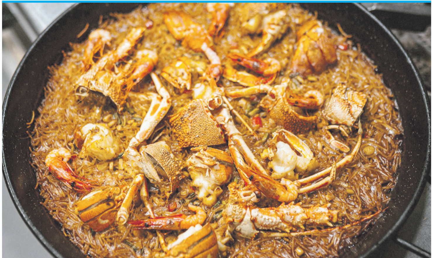
Gewollte Üppigkeit im Nou Manolín in Alicante.

Die Online-Plattform The Fork lässt Lokale nur von Usern bewerten, die über die Webseite reserviert und also dort gegessen haben. Zwar variieren die Bewertungen durch einen eigenartigen Algorithmus ziemlich, doch tauchen einige Lokale immer wieder mit neun und mehr Punkten (von zehn) auf und decken sich auch mit