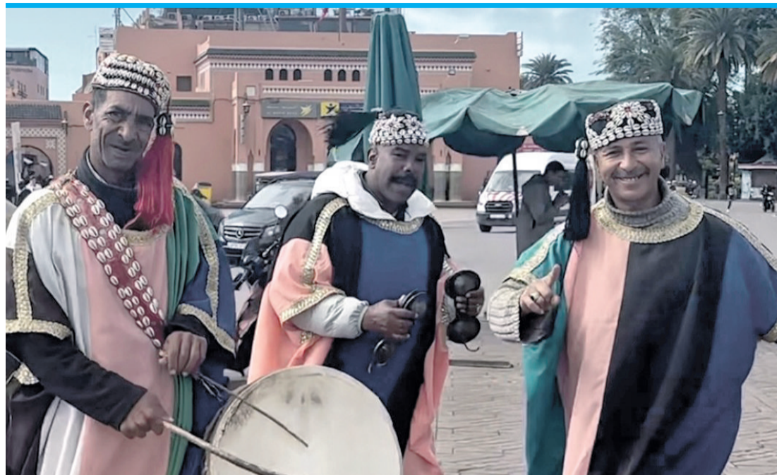
Auf dem Jemaa el Fna schaffen Musiker und Schlangenbeschwörer eine lebhaft Atmosphäre.

Doch der Besuch des Jardin Majorelle ist mittlerweile mit einer gehörigen Portion Hype verbunden. Zunächst muss man sich mit übersteuerten Eintrittspreisen arrangieren – rund 35 Euro für den Zugang und das kleine Yves-Saint-Laurent-Museum, was für viele Besucher eine abschreckende Summe darstellt. Und dann beginnt der eigentliche Spaß: die Wartezeit. Besucher müssen oft in einer langen Schlange anstehen, um in ihrem Zeit-Slot reingelassen zu werden, was den Besuch weiter in die Länge zieht.