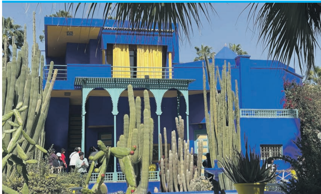
Die majorelleblaue Villa wurde von Jacques Marojelle entworfen.

Ort für einen Kurztrip, der sowohl Abenteuer als auch Entspannung bietet. Mit regelmäßigen Flügen aus Alicante, die nur etwa 1,5 Stunden dauern, ist die marokkanische Stadt bequem erreichbar. In der Metropole prallen zwei Welten aufeinander. Die moderne Neustadt