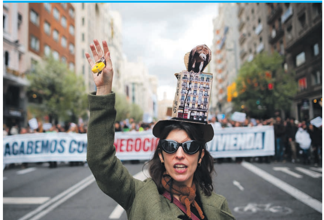
In ganz Spanien gingen Tausende gegen die Wohnungsnot auf die Straße.

Die Zahl der Demonstranten schätzten Verbände in Madrid und Barcelona auf je über 100.000. Die Veranstalter