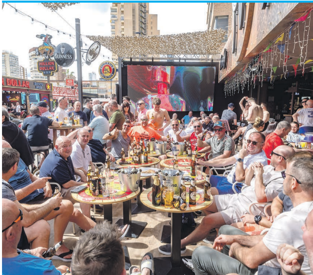
In Benidorm ist es nie ruhig, dafür sorgen die britischen Touristen.

Was Fernández als sicher beschreibt, zeigt sich auf Benidorms Straßen in Form von täglichen Schlägereien in Pubs, Taschendiebstählen in Legionen, illegalem Drogenhandel überall und rund um die Uhr. Denn wie alle Großstädte zieht auch Benidorm allerlei an, das hier alkohol- und urlaubsbedingt auf leichte Opfer trifft. Trotzdem: Der Barkeeper sieht