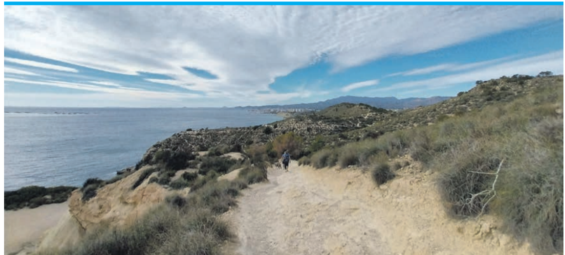
Dramatisch, schön, viel Nichts: Villajoyosas Küstenweg.

Der Weg führt oberhalb vom Meer entlang, auf der rechten Seite schlagen unten die Wellen an die felsige Küste, ein paar schiefe, viel zu kleine Kiefern trotzten dem Wind. Zur Linken bietet sich eine Einzigartigkeit: Schlichtweg nichts. Dieser Kü-