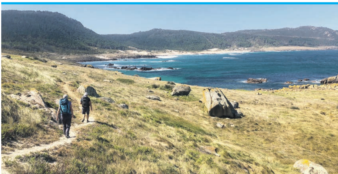
Galicien steht hoch im Kurs. Viele Ausländer zieht es in den Norden Spaniens, Foto: dpa